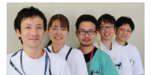
臨床工学技士 (Medical Engineer)