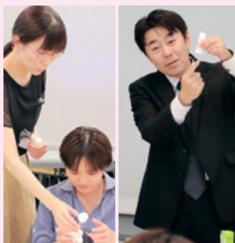
▲当院の薬剤師・看護師も多数参加しました。